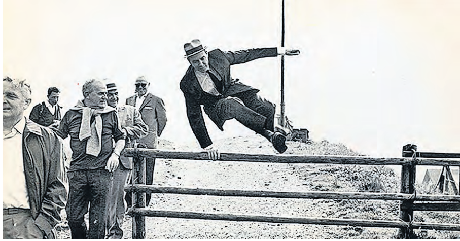
Hans Peter Tschudi, «Vater» der AHV, übersprang auch politische Hürden.