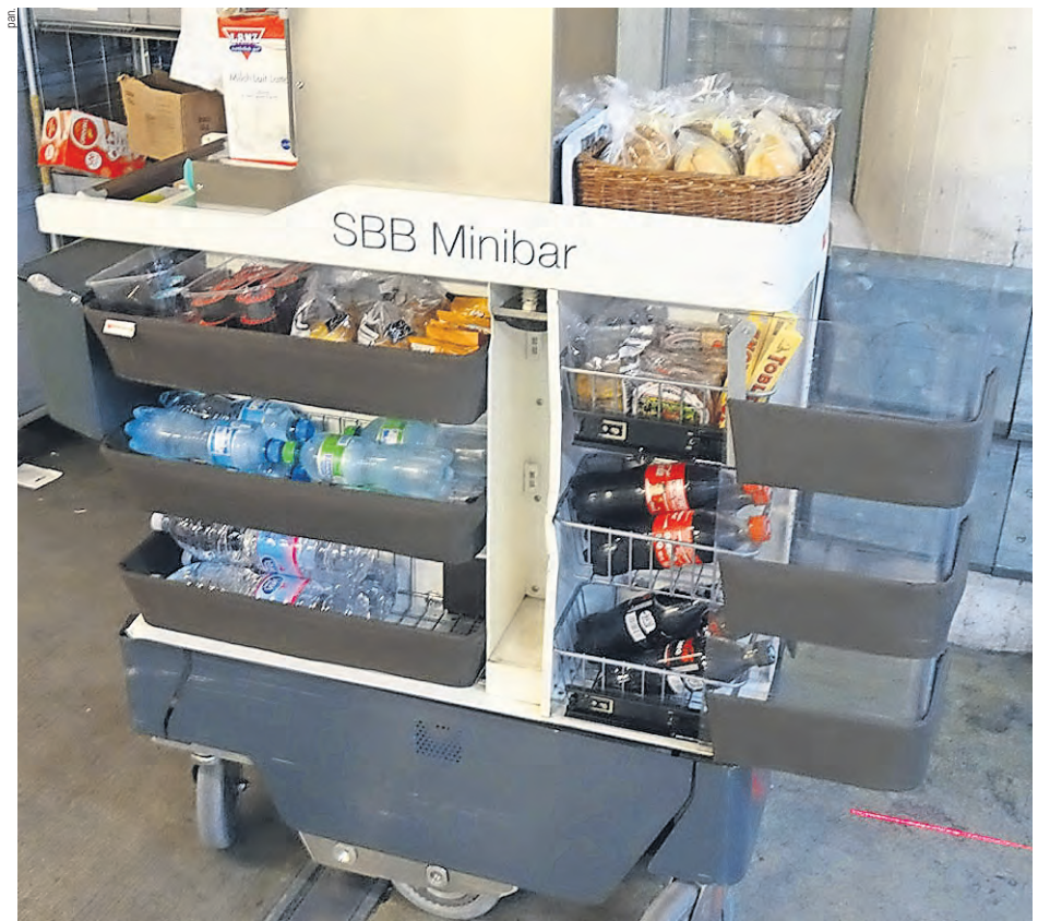
Immer wieder Wirbel um Elvetino.

Basel , 18. September, Personalkantine der Post «Oase», 17–19 Uhr; Zürich , 20. September, Personalkantine «Chez SBB», 13–15 Uhr; Bern , 26. September, Restaurant «Côte Sud», 13–15 Uhr; Brig , 26. September, Stadtbistro, Bahnhof Brig, 17–19 Uhr; Romanshorn , 9. Oktober, Brasserie Bahnhofli, 13–15 Uhr; St. Gallen , 9. Oktober, Migros Restaurant, Bahnhof St. Gallen, 16–18 Uhr.