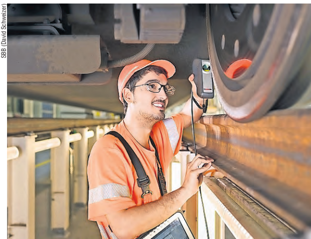
Instandhaltungstechniker in der Serviceanlage Zürich-Herdern.

«Wir halten fest, dass die Auswirkungen auf die Mitarbeitenden nicht transparent dargestellt wurden», schreibt der SEV in seiner Stellungnahme vom 14. Juli zu den Stellenzu-