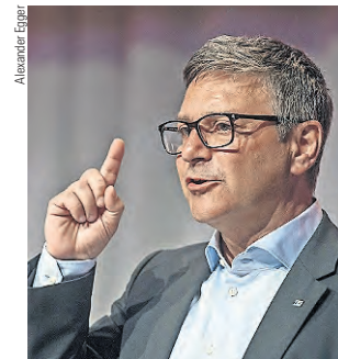
Giorgio Tuti, Präsident SEV.

Die Bundespräsidentin ist als Vorsteherin des UVEK die Eigentümerin der SBB und