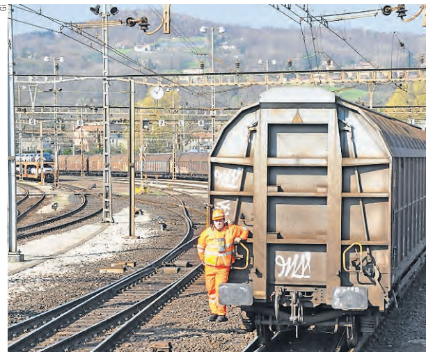
Der Rangierbahnhof Chiasso leistet einen wichtigen Beitrag zur Verlagerungspolitik und erlebt damit eine Renaissance.

2011 und 2012 wurden im RB monatlich 8000 bis 10 000 Wagen rangiert, heute sind es 12 000 bis 14 000, wobei die Monatsspitzen weit höher liegen können: Diesen Mai waren