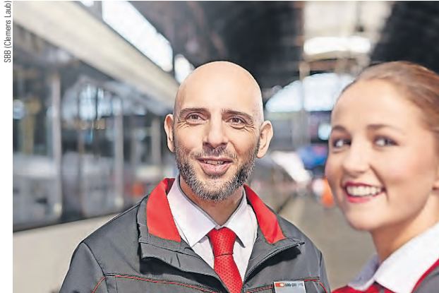
Die neue BAR bringt dem Zugpersonal mehrere Verbesserungen.

Der SEV-ZPV und das Verkehrsmanagement des Personenverkehrs SBB haben die bereichsspezifische Arbeitszeitregelung für das Zugpersonal überarbeitet. Die am 14. August unterzeichnete neue BAR gilt ab Fahrplanwechsel im Dezember und ist für das Personal insgesamt positiv ausgefallen.